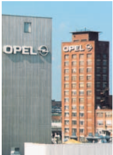
Objekt der Begierde: das Opel-Stammwerk in Rüsselsheim.

Laut der vorgelegten Offerte bringt BAIC 660 Millionen Euro Eigenkapital mit und beansprucht 2,64 Milliarden Euro Bürgschaft des deutschen Staates. Im Fall von Magna ist von 4,5 Milliarden Euro Staatsgarantien die Rede. Das chinesische Konzept sehe weiter vor, dass BAIC 51 Prozent an der neuen Opel-Gesellschaft erwirbt, 49 Prozent verbleiben demnach bei der ehemaligen Muttergesellschaft General Motors.