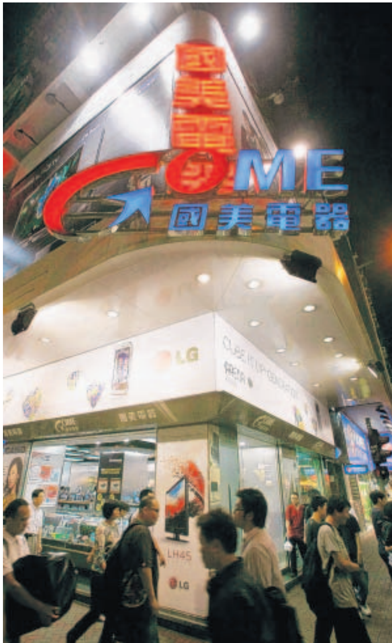
Die Chinesen kaufen mehr ein: ein Gome-Kaufhaus in Hongkong.

Bereits als die Krise begann, war die chinesische Volkswirtschaft – anders als die westlichen – gut in Form. Eine niedrige Staatsverschuldung, stabile Banken und riesige Devisenreserven gaben der Regierung in Peking von Anfang an einen Handlungsspielraum, um den der deutsche Finanzminister Peer Steinbrück sie nur beneiden kann.