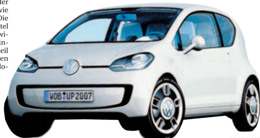
Das VW-Kleinstwagenmodell Up soll neue Käufer anziehen.

* in Prozent; ** Nur für Neukunden und Neuanlagen; alle Angaben ohne Gewähr; Stand 03.07.2009; Quelle: FMH-Finanzberatung (www.fmh.de)